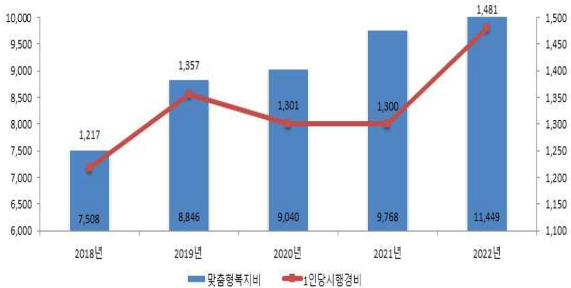
맞춤형복지제도 시행경비 연도별 추이